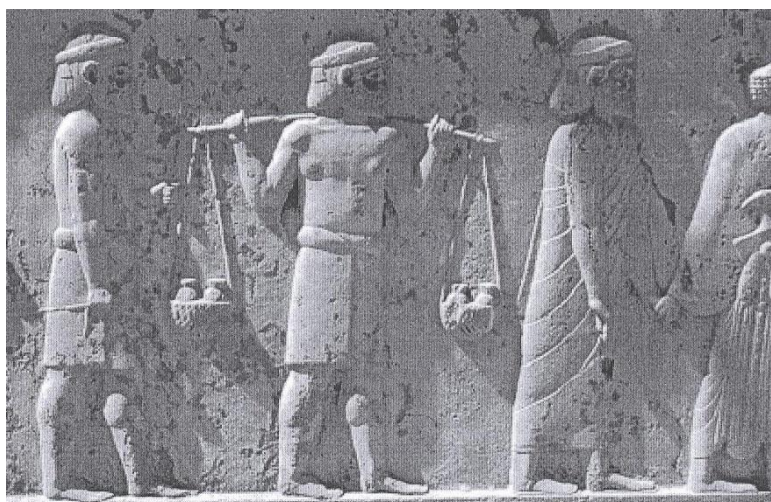
تصویر ۲: آبادانا؛ خراج گزاران هندی در حال حمل بطری‌های عطر

۵. استفاده از کالی‌یوگا ۱ ، معادل ۴۳۲ هزار سال، بخشی از واحد زمان کالپا ۲ ، که برابر عمر برهما ۳ و ۴۳۲۰۰۰۰۰۰۰ سال زمینی و عددی بابلی است و با محدوده زمانی پادشاهی بابلی‌ها، پیش از سیلی که در تواریخ برسوس ۴ و آبیدنوس ۵ به آن اشاره شده، برابر است (ibid: 1963: 238).