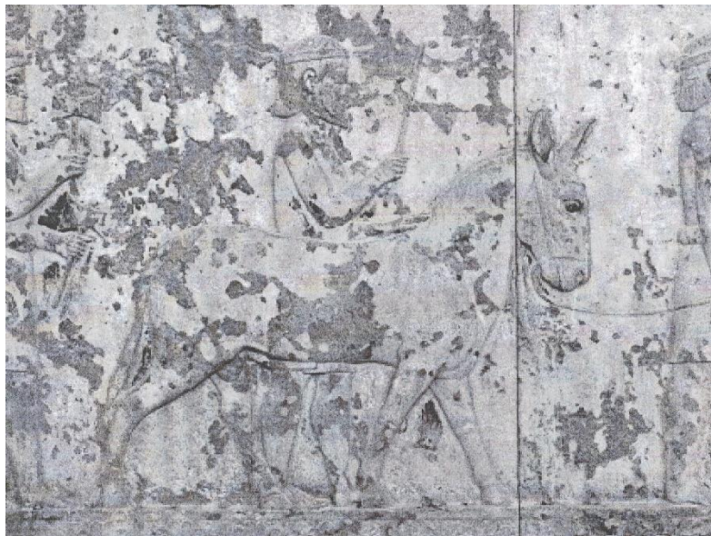
تصویر ۴: ترسیمی از الاغی در هند

۳. این انتقال همان‌قدر که به سلسله هخامنشی و ایرانی‌ها مرتبط بود و می‌توانست ساتراپ‌های دور از هم مانند بابل و هندوش، و گاندارا و تاتاگوش را زیر مجموعه‌ای سیاسی جمع کند، به همان اندازه می‌توانست بر هر نوع نفوذ هخامنشیان در داخل یا نواحی اطراف این ساتراپ‌ها تأثیر بگذارد.