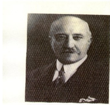
میرزا آسان ماسعود السلطنه