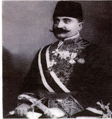
میرزا آسان ماسعود السلطنه وزیر مختار ایران در آلمان و انگلستان و سفیرکبیر ایران در ژاپن

آوانس خان مساعدا السلطنه نخستین سفیر کبیر ایران در ژاپن سال ۱۳۰۹ش.