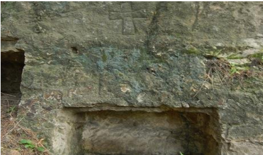
چلیپا و گوردخمه مجموعه غارهای لانگمن