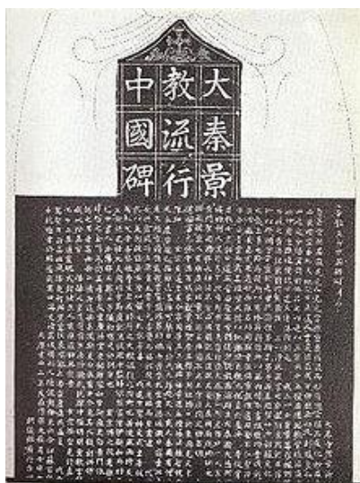
بخشی از متن چینی ستون سیان فو