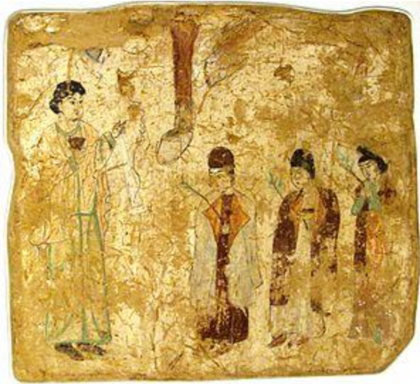
کشیشان نستوری در مراسم عبادی، نقاشی دیواری از کلیسای نستوری کوچو قرن هفتم و هشتم میلادی

۹۶/ فصلنامه تاریخ روابط خارجی، س ۱۷ و ۱۸، ش ۶۸ و ۶۹، پاییز و زمستان ۱۳۹۵