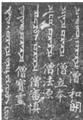
بخشی از متن سریانی و چینی ستون سیان فو