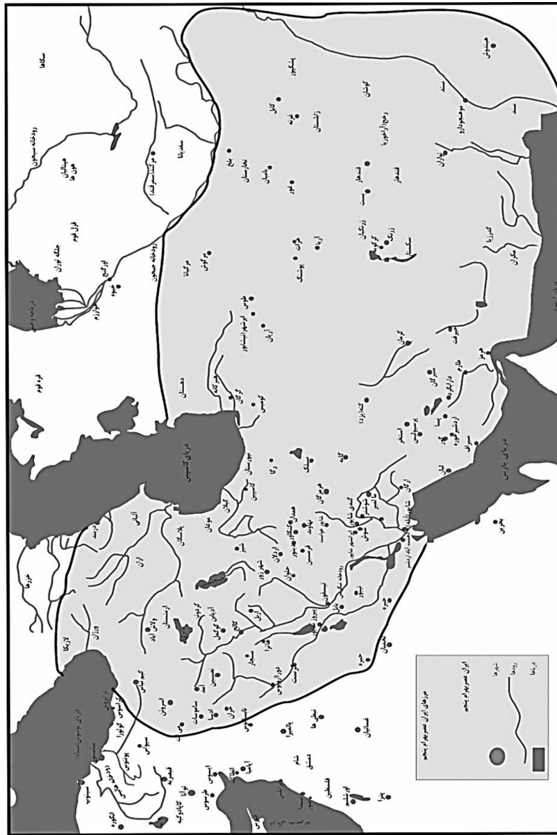
مرزهای ایران عصر بهرام پنجم (گور) ۱ (Rawlinson, 1976: MP)