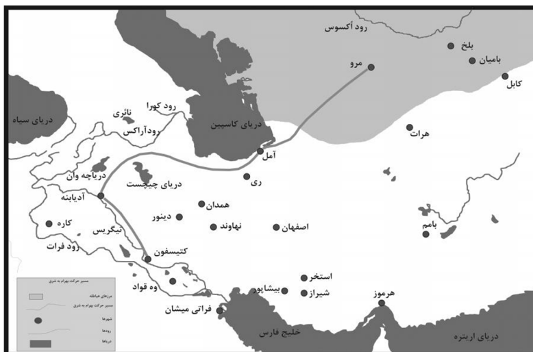
مسیر حرکت بهرام پنجم به مرزهای شرقی ۱ (Farrokh, 2007:MP.)

از جمله غنایم جنگی بهرام، تاج خاقان هیاطله بود که به دستور او برای تزئین آتشکده آذرگشسب، آن را به شیز فرستاد (مشکور، ۱۳۴۲: ۴۱۸؛ زرین کوب، ۱۳۷۳: ۴۵۸؛ مشکور، ۱۳۶۸: ۵۵۲/۱؛ ۲۱۳: Farrokh, 2007). بهرام لشکریان شکست خورده هیاطله را تا کناره‌های جیحون دنبال کرد و آنان درخواست صلح کردند (فردوسی، ۱۳۹۱: ۱۴۱۲، ۱۴۱۳؛ مجمل‌التواریخ، ۱۳۸۱: ۷۰؛ رضا، مجله بررسی‌های تاریخی، ش. ۶۱، س ۱۲؛ دیاکونوف، ۱۳۸۰: ۳۹۷؛ پیرنیا و اقبال، ۱۳۶۴: ۱۹۹). بهرام دستور داد در این محل مناره‌ای بسازند (مجم‌التواریخ، ۱۳۸۱: ۷۰؛ مارکوارت، ۱۳۷۳: ۱۱۱) و دیواری میان ایران و هیاطله بکشند. بهرام زمانی که می‌خواست به سمت آذربایجان حرکت کند، برادرش نرسی را جانشین خود قرار داد و بعد از پایان درگیری‌ها از او خواست تا به سوی مرزهای شرقی به راه افتد و کار بلخ را بر عهده گیرد. بهرام با سپردن ولایت بلخ به برادرش، آنجا به عنوان مرکز حکومت قرار داد و از او خواست با تدابیر پیشگیرانه در این منطقه، از هجوم اقوام شرقی به مرزهای ایران جلوگیری کند (ثعالبی، ۱۳۶۸: ۳۶۰؛