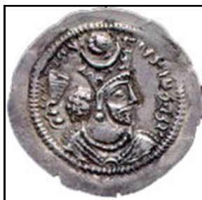
بهرام پنجم (Valentine, 1993:52)

یعقوبی، ۳۷۸۱: ۱۹۹/۱؛ مجمل التواریخ، ۱۳۸۱: ۶۹؛ دریایی، ۱۳۹۰: ۷۴؛ دیاکونوف، ۱۳۸۰: ۳۰۴؛ Greatrex, & Lieu 2002: 38; Theophanes, 1997: p134, 135; Agathias, 1975: 130; Rawlinson, G. 1976: 282.; بنا به گزارش مورخان، یزدگرد سه پسر داشت: شاپور، بهرام و نرسی (کریستن سن، ۱۳۷۴: ۳۷۴؛ فرای، ۱۳۷۳: ۲۴۳، ۲۴۴). شاپور در درگیری‌های ارمنستان کشته شد، ولی به نظر برخی محققان، قتل او در دربار ایران اتفاق افتاد: شاپور چون از مرگ پدر اطلاع یافت، برای دستیابی به تاج و تخت به تیسفون شتافت، اما بزرگان ایران به این سبب که بهرام به‌عنوان ولیعهد ایران انتخاب شده بود، او را دستگیر کردند و در فرصت مناسب به قتل رساندند (نلدکه، ۱۳۷۸: ۱۸۶؛ زرین کوب، ۱۳۷۳: ۴۵۶؛ کریستن سن، ۱۳۷۴: ۳۷۴؛ دیاکونوف، ۱۳۸۰: ۳۰۴؛ پیرنیا و اقبال، ۱۳۶۴: ۱۹۸).