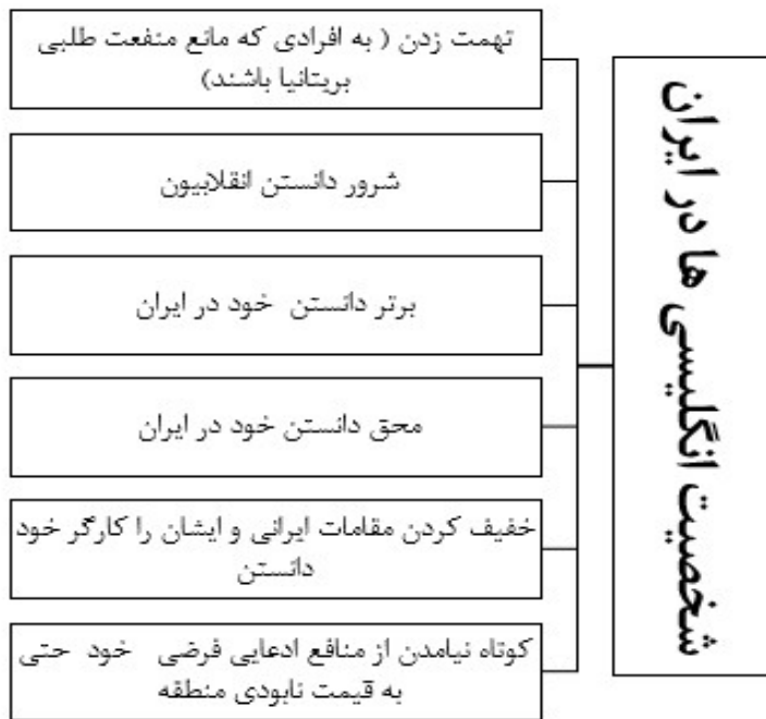
نمودار ۱- شخصیت انگلیسی‌ها در ایران