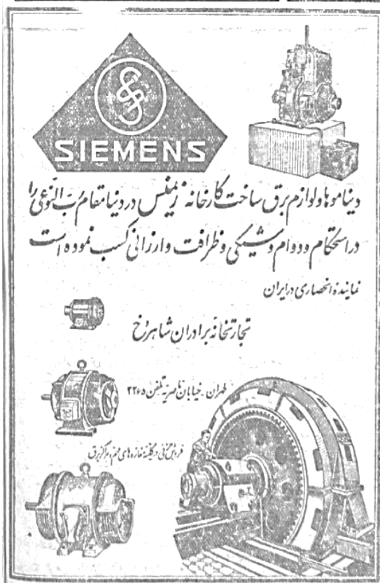
تصویر شماره ۲: تبلیغ تولیدات شرکت زیمنس در ایران، روزنامه امید، ۱۳۱۳ ش.

مؤسسه صرافیه قائمی پور نماینده ۰۰۰ می آروشد و اجازه می دهد بك باب عمارت دسه قطعه زمین باسه نخته فرش هشت و نیم در چهار و نیم به تصدیق طبره باقراط ماهیابه و عالیانه با اختیار نسخ برای خریدار در مدت سه سال تلن ۱۹۶۴ نبره اعلان ۱۷۹ ۸-۵