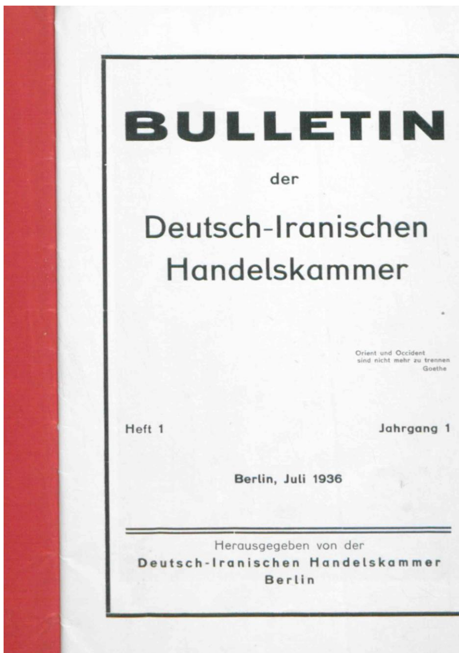
تصویر شماره ۴: جلد بولتن تجاری ایران و آلمان، ۱۳۱۵ش.