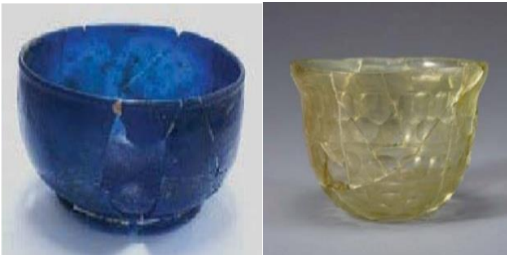
شکل ۴- ظروف شیشه‌ای یافت‌شده در مقابر گیونگجو، محل نگهداری در موزه ملی گیونگجو - کره جنوبی.