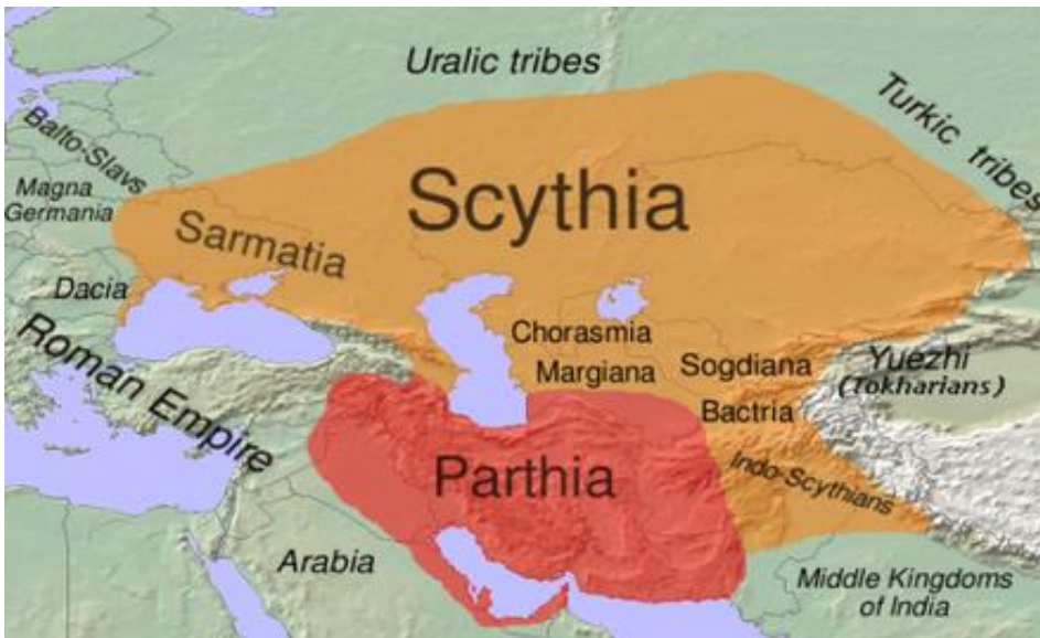
شکل ۳- نقشه فلات ایران و آسیای مرکزی در دوره باستان